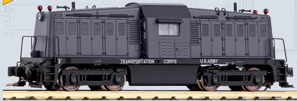
40802 Diesellokomotive BR 65-DE-19-A USATC Ep. II