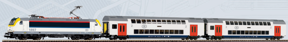
59108 PIKO SmartControl wlan Start-Set SNCB Rh E 186 mit 2 Doppelstockwagen 2. Klasse Ep. VI Länge des Zuges: 753 mm 289,00 €*