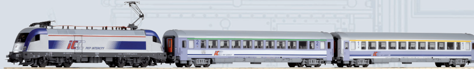
59103 PIKO SmartControl wlan Start-Set PKP Personenzug Taurus IC mit 2 Personenwagen Ep. V Länge des Zuges: 749 mm 279,00 €*