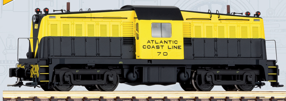
40804 Diesellokomotive Whitcomb ACL