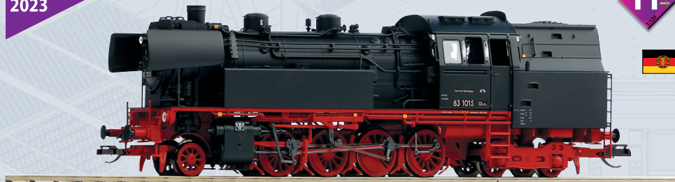
47125 Dampflok BR 83.10 DR Ep. III, inkl. PSD XP S