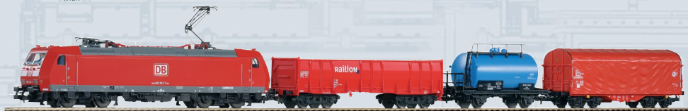
59015 PIKO SmartControl wlan Start-Set DB AG Güterzug BR 185 mit 3 Wagen Ep. VI Länge des Zuges: 616 mm 259,00 €*