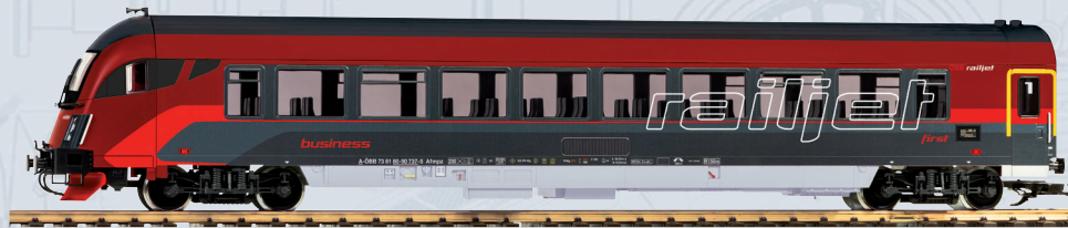
37675 Steuerwagen Railjet ÖBB Ep. VI