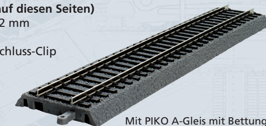
Mit PIKO A-Gleis mit Bettung