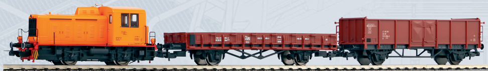
59101 PIKO SmartControl wlan Start-Set Güterzug TKG 2 mit 2 Güterwagen Ep. IV Länge des Zuges: 332 mm 279,00 €*