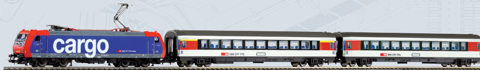
59107 PIKO SmartControl wlan Start-Set SBB Personenzug Re 484 mit 2 Wagen Ep. VI Länge des Zuges: 745 mm 319,00 €*