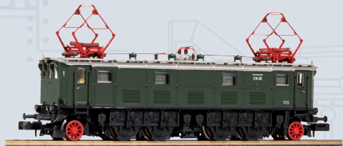
40356 Elektrolokok E16 DB Ep. III, inkl. PSD XP S