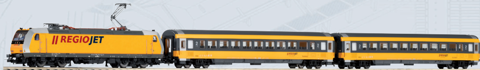
59019 PIKO SmartControl wlan Start-Set Regiojet Personenzug BR 386 mit 2 Personenwagen Ep. VI Länge des Zuges: 745 mm 279,00 €*