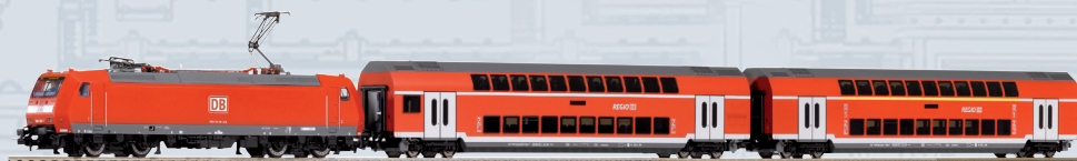
59102 PIKO SmartControl wlan Start-Set DB AG Personenzug BR 146 mit 2 Doppelstockwagen Ep. VI Länge des Zuges: 753 mm 289,00 €*