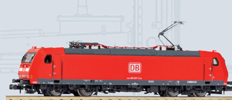
40581 Elektrolokok BR 185 DB AG Ep. VI, inkl. PSD XP S