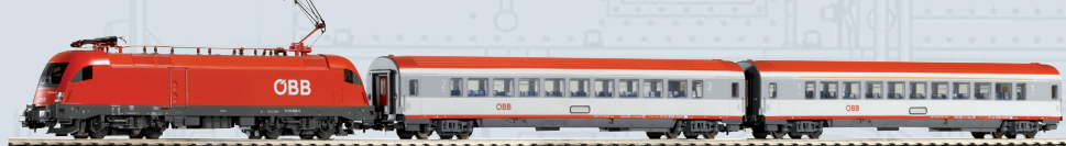
59104 PIKO SmartControl wlan Start-Set ÖBB Personenzug Taurus mit 2 Schnellzugwagen Ep. V Länge des Zuges: 749 mm 279,00 €*