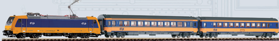
59016 PIKO SmartControl wlan Start-Set NS Intercity BR 185 mit 2 Personenwagen Ep. VI Länge des Zuges: 750 mm 259,00 €*