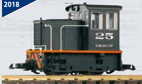
38500 Diesellok GE 25-Ton D&RGW 199,00 €*