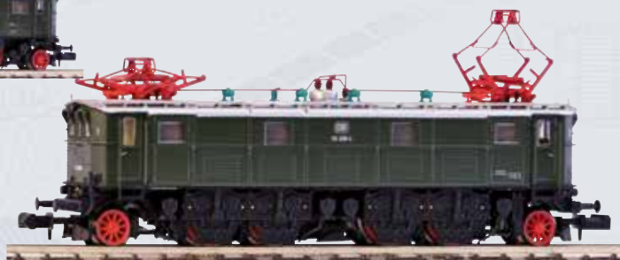
40350 E-Lok BR 116 DB Ep. IV