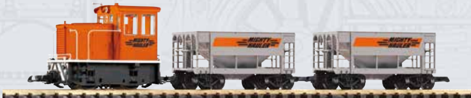
37150 Start Set GE 25-Ton