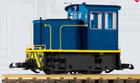
38502 Diesellok GE 25-Ton Industriellok 199,00 €* Blau-Gelb

PIKO hat das Vorbild der kleinen GE 25-Ton detailliert und liebevoll umgesetzt. Die Neukonstruktion überzeugt durch feinste Lackierung und Bedruckung, eine filigrane und doch robuste Gesamterscheinung und lässt sich im Gartenbahnbereich vielseitig einsetzen. Das PIKO Modell besitzt präzise gefertigte Radsätze und eine sehr sichere Stromabnahme vom Gleis.