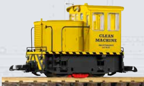
38501 Diesellok GE 25-Ton 219,00 €* Gleisreinigungslok, mit Batterie betrieben

Im Vorbau der Lok befindet sich das Batteriefach für insgesamt 6x AAA Batterien/Akkus (nicht im Lieferumfang enthalten).