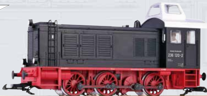
37532 Diesellokomotive BR 236 DB Ep. III, mit Kanzel