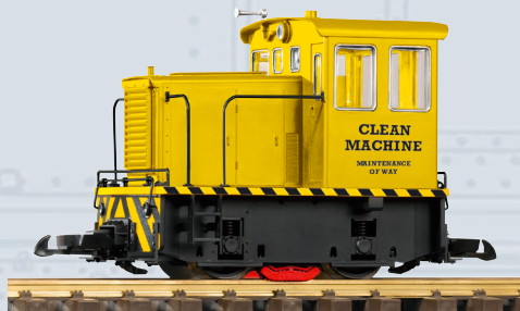
38501 Loco Diesel GE 25-Ton per la pulizia delle rotaie, funziona a batteria

Nello stelo della locomotiva si trova il vano batteria per un totale di 6 batterie AAA / batterie ricaricabili (non incluse).