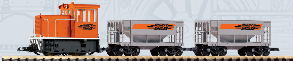
37150 Start Set GE 25-Ton