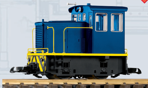
38502 Loco Diesel GE 25-Ton Industriale Blu-Gialla

PIKO ha implementato il dettaglio del modello della piccola GE 25. Il nuovo design convince per la verniciatura perfetta e la stampa delle scritte molto raffinate; la robustezza assicura un utilizzo anche negli impianti da giardino. Il modello PIKO dispone di assali montati con precisione che ne garantiscono una forza di trazione molto affidabile.