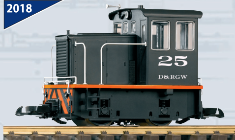
38500 Loco Diesel GE 25-Ton D&RGW