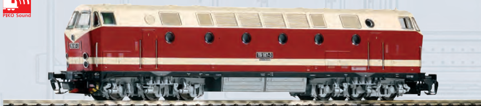
47345 Diesellok BR 119 DR Ep. IV, Spitzenlicht unten / Soundlok