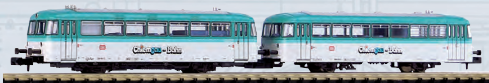
40253 Dieseltriebwagen BR 798 Chiemgau-Bahn Ep. IV-V

Die PIKO BR 82 verfügt über einen digital schaltbaren fahrtrichtungsabhängig funktionierenden Lichtwechsel weiß/weiß und eine Schnittstelle Next18. Das Modell mit Zinkdruckgussrahmen verfügt über einen kräftigen Motor für hervorragende Fahreigenschaften.