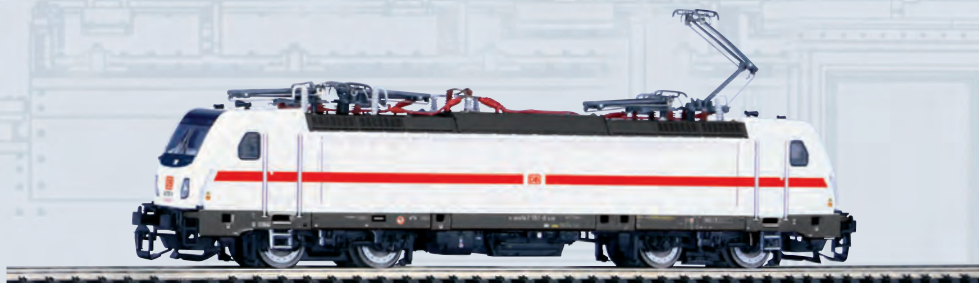
47454 E-Lok BR 147.5 DB AG IC Ep. VI