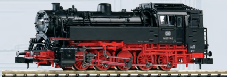
40102 Dampflokomotive BR 82 DB Ep. IV