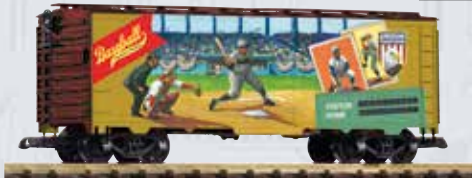
38923 Güterwagen Amerikanische Traditionen Baseball