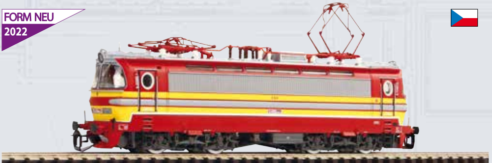
47540 Elektrolok BR S 499.1 ČSD Ep. IV