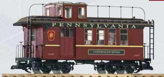
38660 Güterzugbegleitwg. PRR 21015