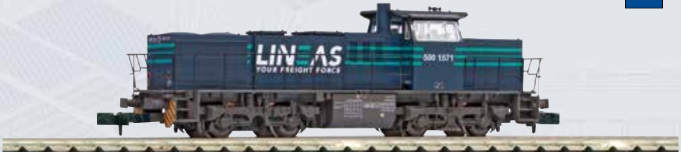
40482 Diesellokomotive G 1206 LINEAS NL Ep. VI