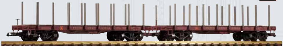
38779 Flachwagen 2er Set PRR mit Rungen