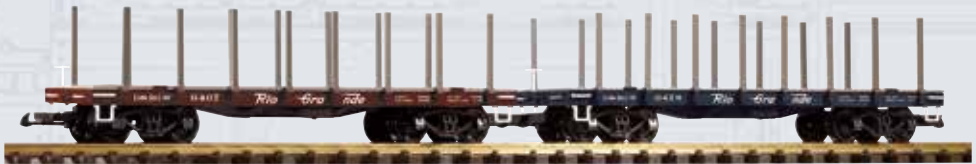
38778 Flachwagen 2er Set D&RGW mit Rungen