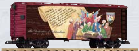
38942 Güterwagen Amerikanische Traditionen Independence